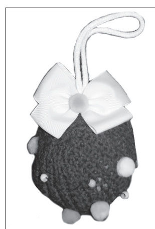
Шар Арины Лариной

Все игрушки, участвующие в конкурсе, украсят ёлку в районном Доме культуры. А победителей ждут призы.