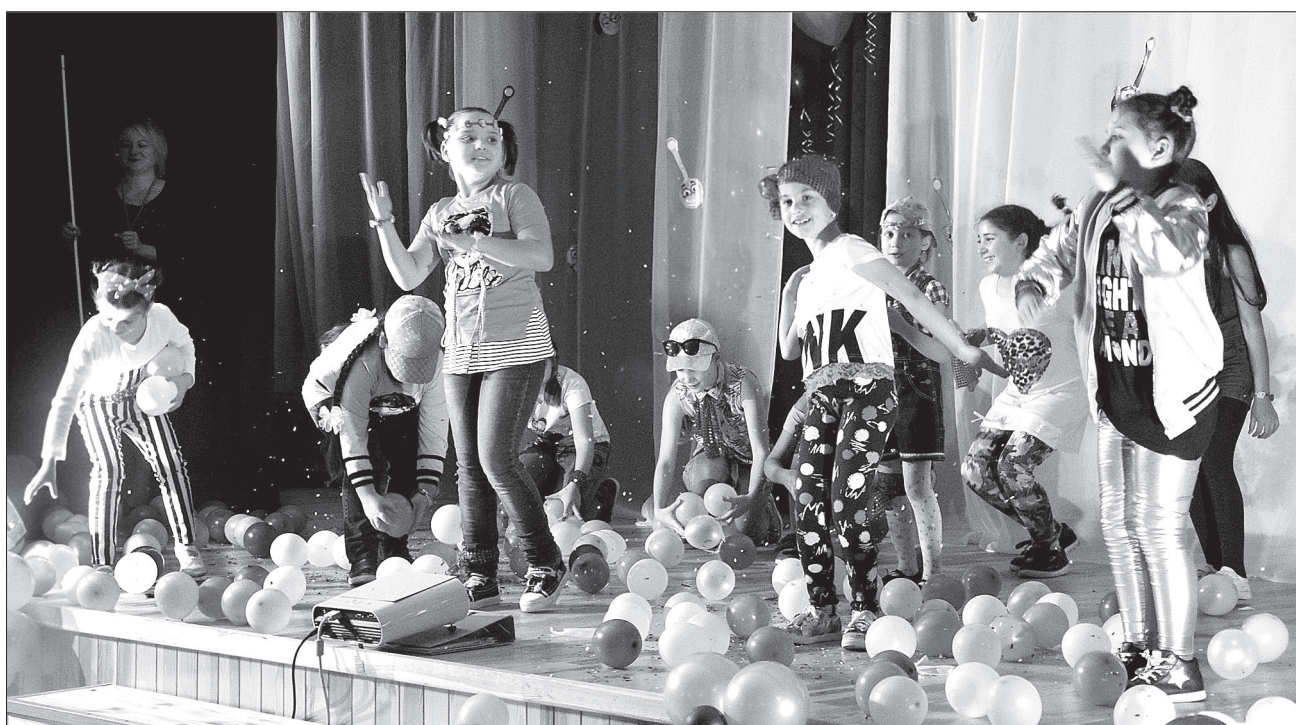
Участники объединения «Друзья театра» поздравили «Контакт» с юбилеем

— Нам очень нравится центр. На занятиях к каждому ребёнку свой подход, отношение к детям просто отличное. Всегда что-то новенькое, интересное. Дочь с удовольствием бежит туда. «Контакт» — самый лучший, мы его обожаем!