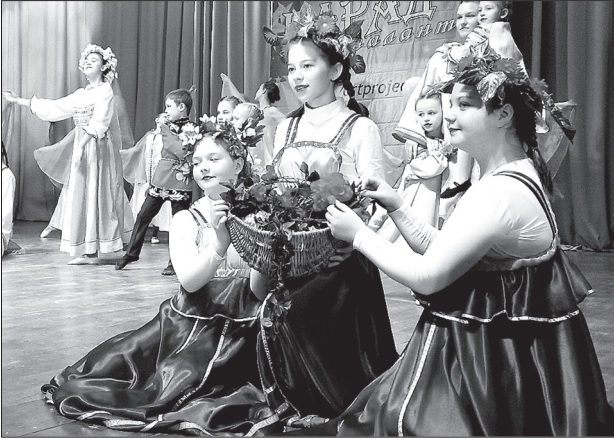
Участники танца «Святая Русь»