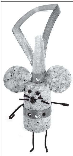
Сказочный «Мышонок-звездочёт» выполнен из пробки и проволоки

Со 2 по 12 декабря проходит Всероссийская декада подписки, цена на «Новую Мещёру» в этот период снижена.